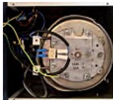
Resistencia fuera del tanque para evitar daños de corrosión