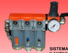
SISTEMA DE FILTRADO Y ANTIHUMEDAD DE 3 ETAPAS

Compresores silenciosos, depósitos con capacidad de 50, 80 y 100 litros. Motor de pistón seco por lo que no necesita mantenimiento de aceite. Incorporan un sistema de filtrado y antihumedad del aire de 3 etapas para evitar que el aire a presión lleve humedad a los equipos conectados.